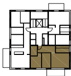
MIESZKANIE NR 9