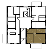
MIESZKANIE NR 3